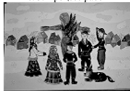
Рис.6. Готовая работа