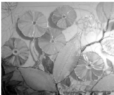
Рис. 10. Применение скелетонов для декора