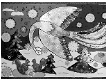
Рис. 2. Аппликация витраж