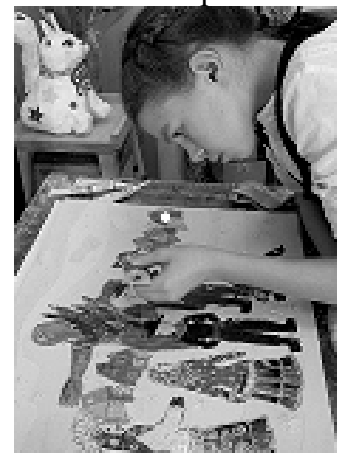
Рис. 3. Процесс работы