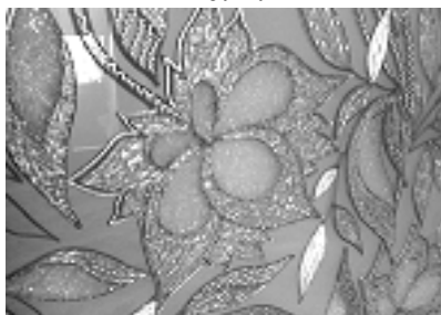
Рис. 7. Применение структурных паст