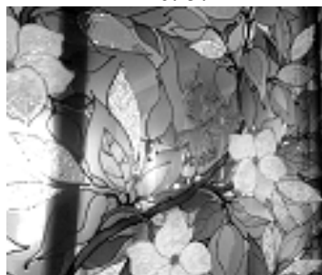
Рис. 8. Создание фактуры лепестков цветка