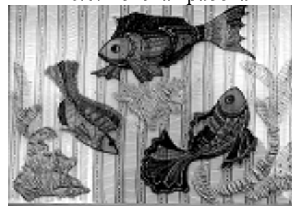
Рис.9. Применение структурных паст