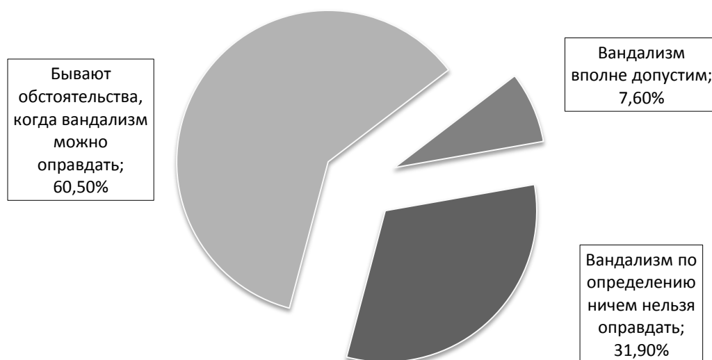
Рис. 3. Оценочная модальность отношения опрошенных к вандализму (закрýтый вопрос, % от числа ответивших)

Большинство опрошенных воспринимают вандализм как явление, которое обществом обычно осуждается – именно поэтому, видя уже предложенные варианты ответа, большинство из них выбирают именно негативные наименования. Вместе с тем многие из них сами относятся к явлению вандализма скорее гибко, не склоняются к чисто негативным интерпретациям и признают, что в определенных обстоятельствах вандализм нельзя трактовать однозначно – именно поэтому при открытом вопросе, лишенном «подсказывающих» вариантов ответа, наряду с негативными ассоциациями звучат и скорее позитивные. Таким образом, несмотря на преобладающие негативные интерпретации вандализма, большинство опрошенных придерживается гибкого отношения к этому явлению и допускают возможность его оправдания.