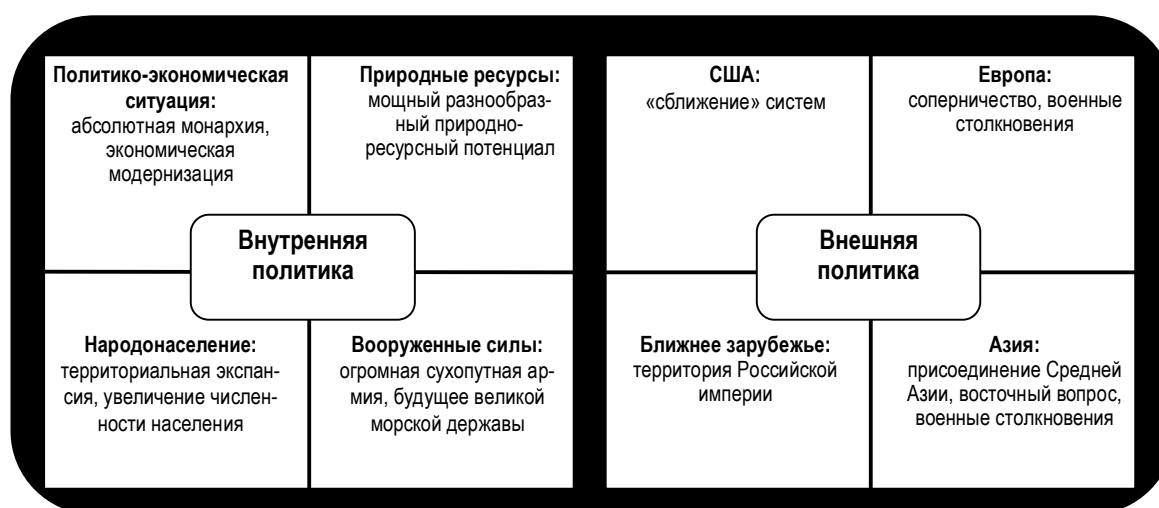
Рис. 3. Когнитивно-дискурсивная матрица (середина XIX — начало XX в.)

Схематично статическая матрица, созданная при анализе фактического материала в политическом дискурсе США середины XIX — начала XX в., представлена на рисунке 3.