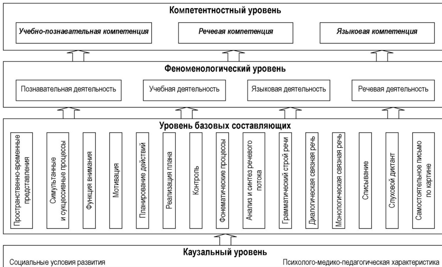
Рисунок 1. Четырехкомпонентная модель анализа ключевых компетенций младших школьников