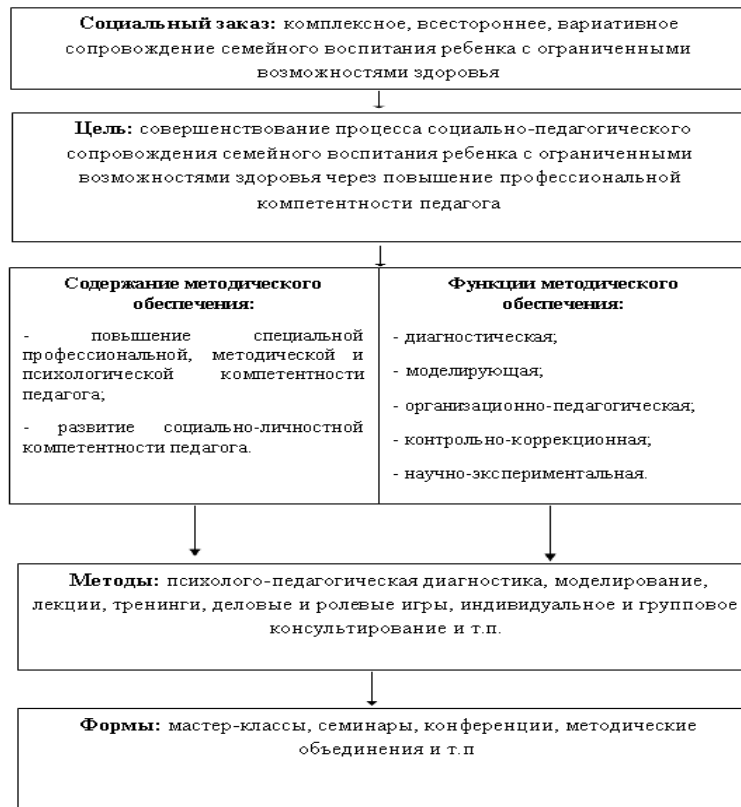
Рисунок 3. Модель методического обеспечения социально-педагогического сопровождения

Методическое обеспечение социально-педагогического сопровождения является элементом организационно-управленческого компонента системы и направлено на повышение его эффективности. Поэтому целесообразно выделить функции методического обеспечения: диагностическую, моделирующую, организационно-педагогическую, контрольно-коррекционную, научно-экспериментальную. Модель методического обеспечения социально-педагогического сопровождения отражена на рис. 3.