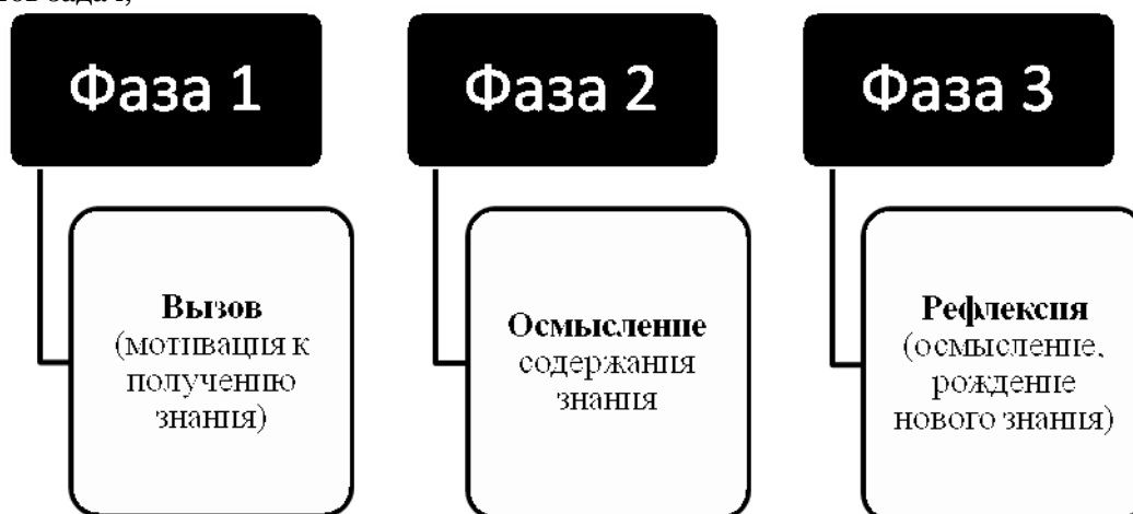
Рисунок 1. Трехфазная структура урока

В основе данной технологии лежит трехфазная структура урока (рис. 1).