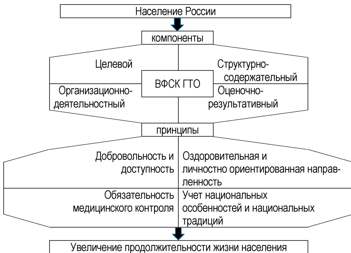
Рис. 1. Концептуальная модель воспитательной системы ВФСК ГТО

Формирование такой потребности является одним из целевых показателей воспитательной системы «Всероссийский физкультурно-спортивный комплекс «Готов к труду и обороне»» (ВФСК ГТО), концептуальная модель которой представлена на рис. 1.