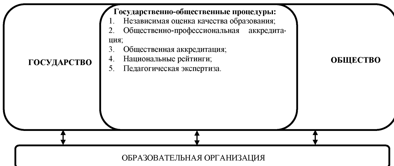
Схема 1. Государственно-общественные процедуры управления образованием

В нашем исследовании хотелось подробнее остановиться на произошедших законодательных изменениях в этом направлении, а именно в направлении независимой оценки качества образования. Благодаря изменениям и дополнениям, которые внес федеральный закон от 21.07.2014 г. №256-ФЗ в закон об образовании в РФ, независимая оценка из некоего феномена превратилась в более структурированную деятельность. Данные изменения вступили в силу с 21 октября 2014 г. Существенно изменились цели НОКО, четко разведены ее составляющие. Мы видим, что теперь НОКО включает в себя две области оценивания: независимую оценку качества подготовки обучающихся и независимую оценку качества образовательной деятельности организаций, причем, независимую оценку качества образования правомочны осуществлять только юридические лица, выполняющие оценку в перечисленных выше областях.