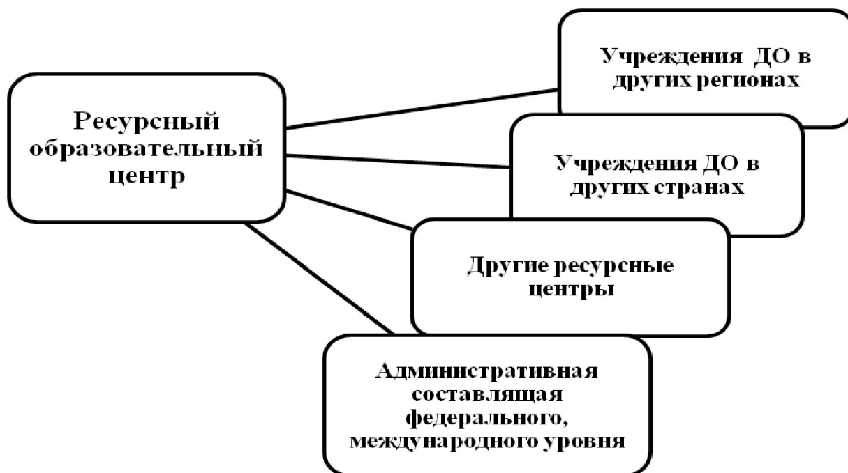
Рис. 3. Внешняя структура сетевого взаимодействия дополнительного образования

Определяя потенциал сетевого социокультурного взаимодействия, обратимся к возможным видам деятельности сетевых партнеров дополнительного образования по развитию культуры профессиональной ориентации [2].