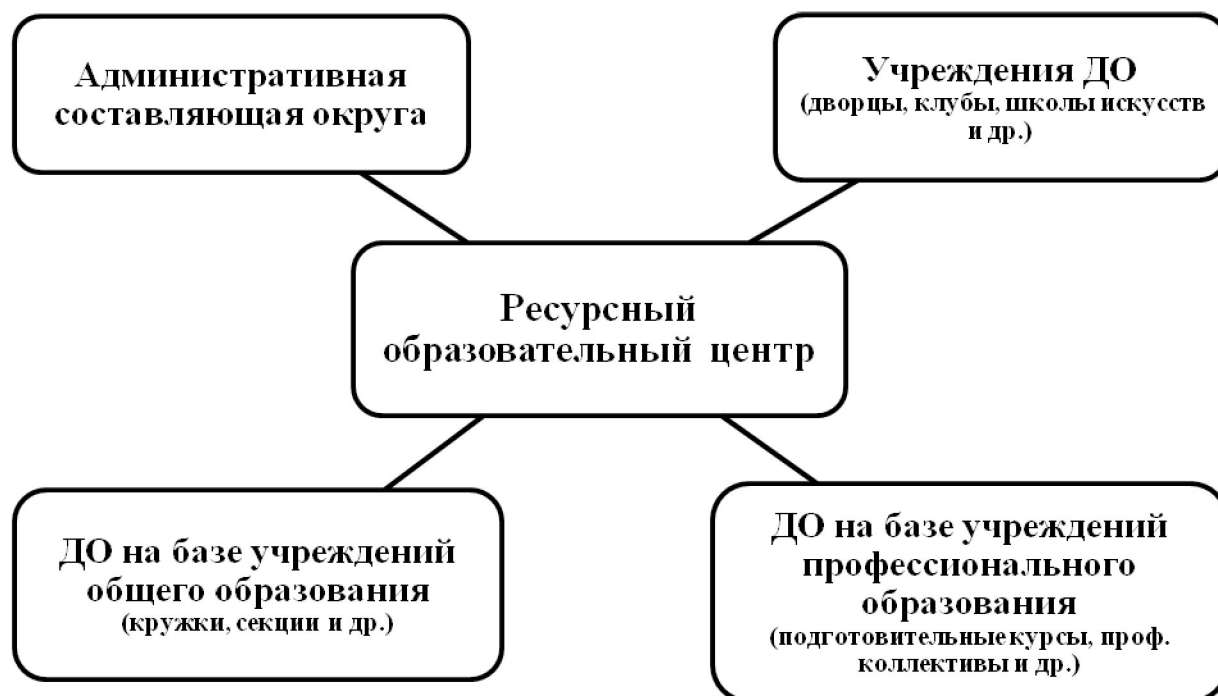
Рис. 2. Внутренняя структура сетевого взаимодействия дополнительного образования

Внутренняя сетевая структура такого взаимодействия предполагает интеграцию ресурсной базы учреждений дополнительного образования школ, высших и средних учебных заведений и учреждений дополнительного образования, находящихся вне обязательного образовательного процесса, административные ресурсы и консолидацию всех образовательных потоков внутри ресурсного центра (рис. 2).