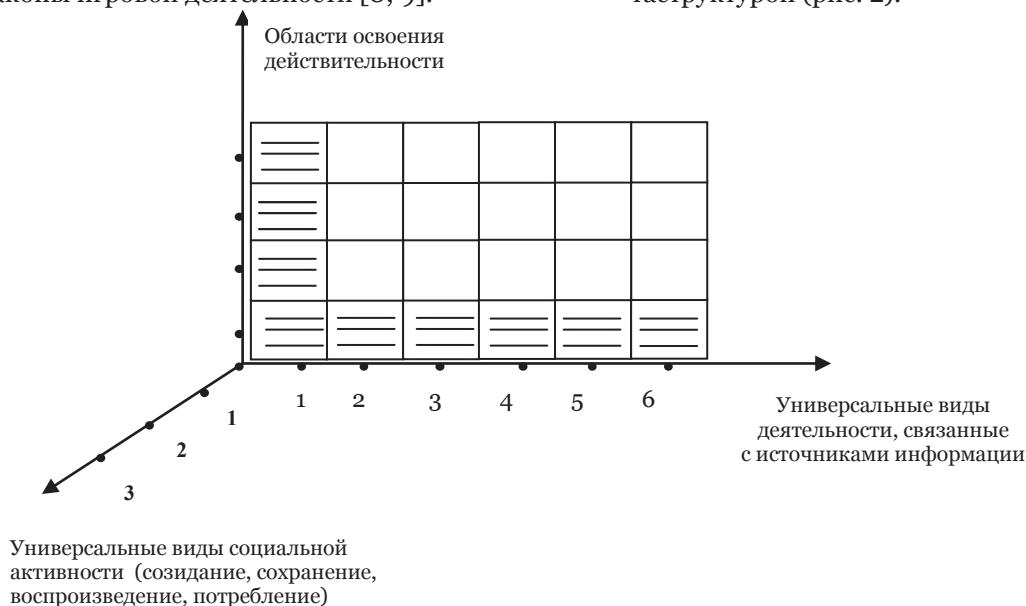
Рисунок 2. Трехмерная метаструктура социальной активности для определения универсальных видов учебной деятельности

Итак, все многообразие видов учебной деятельности определяется трехмерной метаструктурой (рис. 2).