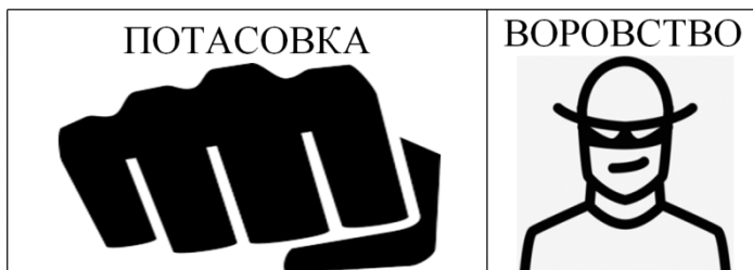
Рисунок 1 — Пример карточек действия

После ознакомления с целями игры и остальными участниками, игрокам дается 30 минут для выполнения всех задач с помощью коммуникации с остальными персонажами. На это время каждый ученик должен отыгрывать своего героя, его поведение, действия и повадки. Чаще всего участники выполняют свои цели не только за счет коммуникации с членами своей команды и остальными игроками, но и за счет грамотного использования предметов, каждый из которых имеет свою функцию и правила использования. Все игровые предметы, выполненные в форме карточки с рисунком и текстом, делятся на общие и индивидуальные. Особую группу предметов составляют карточки (Рисунок 1) действий — «Потасовка», дающая игрокам возможность выиграть предмет у другого участника и «Воровство», позволяющая персонажу выкрасть необходимый ему предмет. Для использования данных карточек необходим шестигранный кубик с цифровыми обозначениями, находящийся у ведущего (учителя).