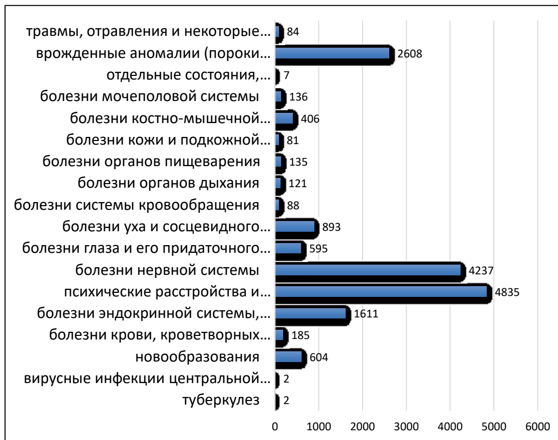
Рис. 1. Структура заболеваний детей-инвалидов в Свердловской области в 2018 г.

Следующее исследование касается причин заболеваний детей с ограниченными возможностями здоровья в Свердловской области в 2018 году. Структура заболеваний детей в Свердловской области в 2018 г. представлена на рисунке 1.