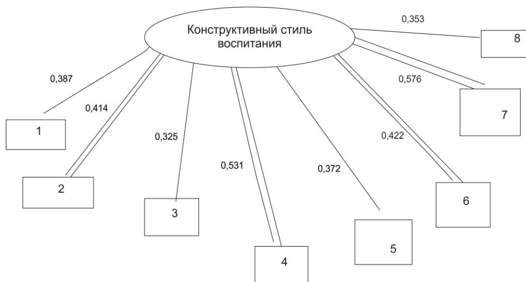
Рис. 3. Корреляционная плеяда связей страхов старших дошкольников с конструктивным стилем родительского воспитания

Примечание: 1 – социальные страхи; 2 – общее количество страхов; 3 – пространственные страхи; 4 – страх персонажей; 5 – боязнь животных; 6 – страх темноты; 7 – страх смерти; 8 – страх физического ущерба.