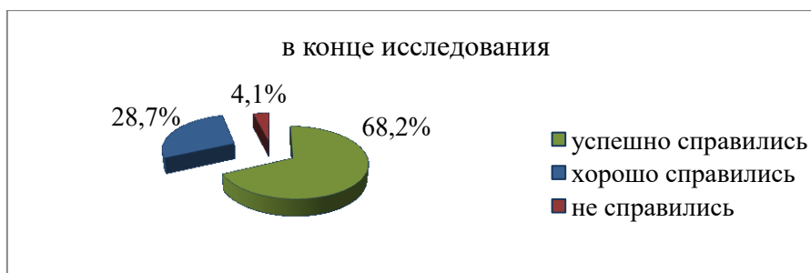
Рис. 3. Данные, полученные в конце обучения

Сравнив данные результатов экспериментальной группы до начала исследования (N=34,5%) и после проведения обучения (N=96,8%), мы выявили, что показатели речевой компетенции в умениях компрессии, обобщения и перевыражения текста-оригинала значительно улучшились. В то время как данные результатов контрольной группы до начала и после проведения опытно-экспериментальной работы существенно не изменились. Вместе с этим, респонденты экспериментальной группы отметили, что если текст был достаточно простым, то они могли перевести его на русский язык, не пользуясь словарем.