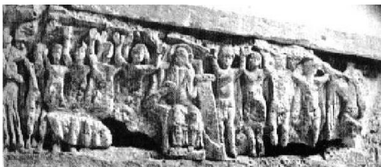
Рис. 1. Рельеф на саркофаге св. Агильберта VII века