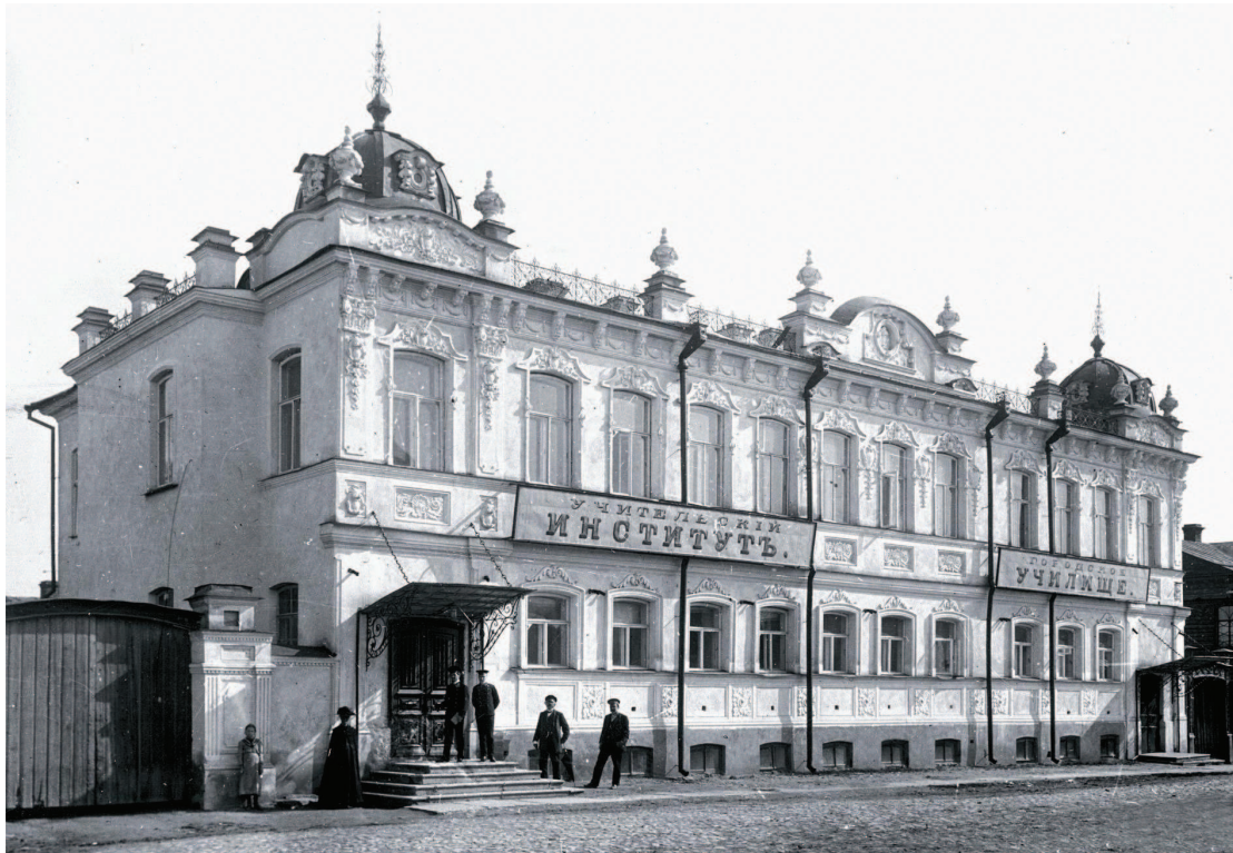
Здание Екатеринбургского учительского института (фотография начала XX в.)

Здание это сохранилось до наших дней в несколько перестроенном виде (дом надстроили на два этажа). Сейчас в нем находится Институт геологии и геохимии Уральского научного центра (Почтовый переулок, 7).