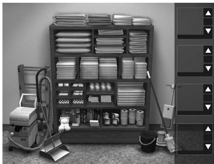
Рис. 3. Housekeeping, задание 2