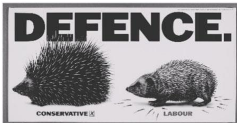
Рис. Плакат Консервативной партии Великобритании (1992 г.)

Промежуточное положение занимают плакаты, в которых вербальный код является необходимым дополнением к иконическому. Рассмотрим в качестве примера плакат Консервативной партии 1992 г., семантической доминантой которого служит изображение двух ежей. Первый еж обладает колючками, а второй, лишенный колючек, имеет жалкий и незащищенный вид. Тема плаката — DEFENCE — выражена вербально на заднем плане. Надпись Conservative под изображением ежа, вооруженного колючками, выполнена в традиционном для Консервативной партии синем цвете. Красная надпись Labour располагается под изображением ежа, который потерял колючки. Плакат призывает поддержать консерваторов, которые готовы выделять средства на оборону. Авторы плаката визуализируют данную идею с помощью образа ежа, который может защитить себя в случае опасности. Вербальный код выполняет вспомогательную функцию, делая отсылку к понятийной сфере «Политика». Изображение имеет многоплановую структуру, смысл которой становится понятен лишь при сопоставлении мира животных и мира политики, отправной точкой для подобного рода ассоциаций служит слово DEFENCE. Метафоричность изобразительного плана плаката имеет высокий воздействующий потенциал, поскольку зрительный образ ежа, лишенного колючек, привлекает внимание и обескураживает. Контраст между двумя политическими позициями, представленный в рисунке, апеллирует к эмоциональной сфере получателя информации.