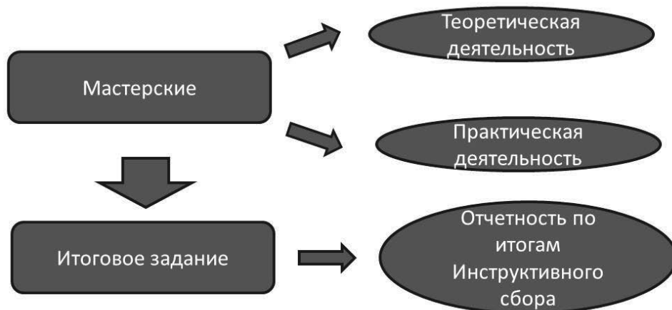
Рис.1. Существующая организационная модель подготовки вожатских кадров

Для того чтобы создать нормативную модель подготовки вожатских кадров, мы провели исследование мнения вожатых, подготовленных на Инструктивном сборе в 2018 г. Более 50% респондентов (вожатые, уже прошедшие воспитательную практику в детском лагере)