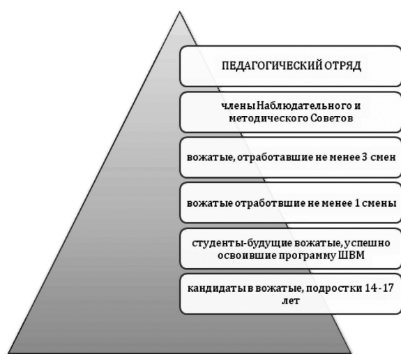
Рис. 1. Состав Педагогического отряда Чу ДО ПАО «ММК» «ДООК» по уровням

(старшие вожатые, педагоги дополнительного образования, педагоги-организаторы), Совет Педагогического отряда (члены Наблюдательного и Методического Советов, кураторы Школ вожатых, аниматоров и волонтеров). Членами педагогического отряда являются: вожатые, отработавшие в ДООЦ не менее 3 смен (наставники), отработавшие в ДООЦ не менее 1 смены (хранители традиций), будущие вожатые, успешно освоившие образовательную программу «Школы вожатского мастерства» – (вожатые), будущие помощники вожатых, старшеклассники 14-17 лет, занимающиеся по программам: «Школа вожатского мастерства», «Волонтер», «Аниматор» (кандидаты в вожатые).