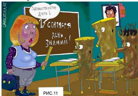
Рисунок 11 называется «День знаний». На рисунке также

изображен класс, но вместо учеников в нем сидят пни. На наш взгляд данное изображение является иллюстрацией выражения «тупой (глупый) как пень» и подчеркивает умственную неразвитость всех современных школьников.