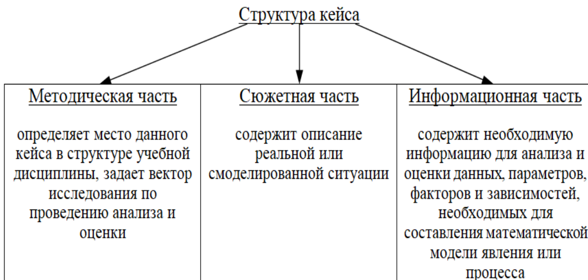
Рис. 1. Структура кейса

Как показал анализ педагогической и методической литературы структура кейса образуется тремя составляющими: сюжетной частью, информационной частью и методической частью. Выделим структурные единицы для кейса, который будет использоваться для подготовки будущих инженеров-технологов к анализу и оценке химико-технологического процесса (рис. 1.):