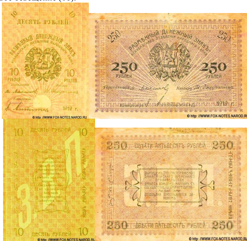
Рис. 1, 2, 3, 4. Денежные купюры с достоинством 10 и 250 рублей с надписями на туркменском и армянском языках, написанными по краям на реверсе

это относится только к русскоязычным работам, ибо в нашей статье, выполненной на турецком языке и опубликованной в 2016 году, данная тема впервые в той или иной степени полноты получила свое освещение (16).