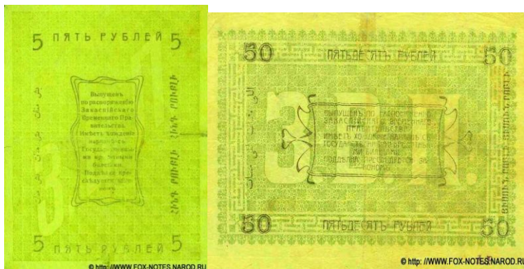
Рис. 5, 6, 7, 8. Денежные купюры с достоинством 5 и 50 рублей с надписями на туркменском и армянском языках, написанными по краям на реверсе

Реверс купюров в своем центре содержит сокращение в виде больших по объему букв З.В.П., которое расшифруется как Закаспийское Временное Правительство. Основу реверса составляют следующие предложения: “Выпущен по Распоряжению Закаспийского Временного Правительства. Имеет хождение наравне с государственными кредитными билетами. Подделка преследуется законом”. Как в аверсе, достоинство банкнотов повторяется в реверсе приведением соответствующих цифр, а именно 5, 10, 25, 50, 100 и 250. Они повторяются со словами на русском, туркменском и армянском языках (транскрипция туркменских слов в квадратных скобках с применением современного алфавита добавлены автором данной статьи):