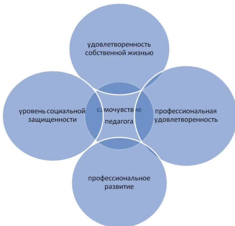
Рис. 2 Основные блоки схемы мониторинга