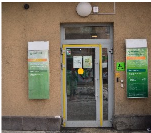
Рис. 2 Входная группа «Сбербанк», улица 8 Марта, 99В.