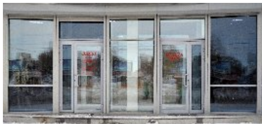
Рис.1 входная группа в магазин «Мягкое золото».

мер: надписи на дверях помогают донести до человека информацию в каком месте он может попасть в то или иное здание. На рис.1 представлена входная группа в магазин «Мягкое золото», находящийся по адресу: город Екатеринбург, 8 марта, 73.