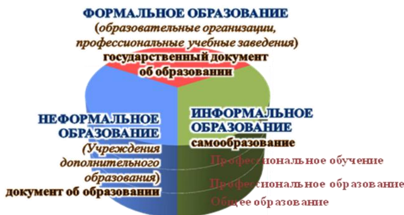
Рис.1. Структурная модель непрерывного образования по Концепции ЮНЕСКО.

Основные компоненты непрерывного образования охватывают все ступени образовательного процесса по вертикали, в них реализуется преемственность сквозного этнокультурного и поликультурного содержания (Рис. 1).