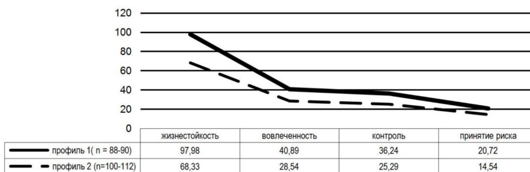
График 1. Типологический/профильный анализ данных

4,82 ). То есть уровень жизнестойкости наших испытуемых основывается, преимущественно, на вовлеченности и контроле, и в меньшей степени – на принятии риска. Проведенный типологический (профильный) анализ позволил разграничить две группы испытуемых. Одна из них с более высокими значениями по всем параметрам жизнестойкости, а другая – с более низкими. Их профили видны на графике 1.