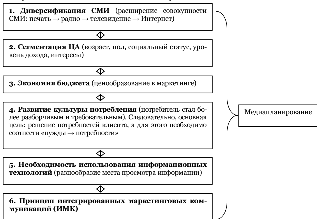
Рис. 1. Предпосылки возникновения медиапланирования

Термин «медиапланирование» стал использоваться во второй половине XX века в США, его первоначальная задача заключалась в упорядочении работы между заказчиками рекламы и СМИ, позднее в эту цепочку вошли и рекламодатели. В своем прикладном значении медиапланирование определяют как процесс выбора канала, рекламного средства, места, времени, размера, частоты размещения рекламы и его обоснование.